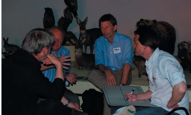
Plan09 projektet i Svendborg Kommune har været tilrettelagt som en række af "stafetter", hvor forskellige aktører livligt og engageret satte begrebet livskvalitet og "det gode liv" til debat og kom med bud på, hvad det konkret betyder i Svendborg.

Kvalitetsdiskussionerne forløb som en stafet fra en aktør til den næste. Fokus har været på at respektere og styrke Svendborgs 'personlighed' - historie og identitet - som udgangspunkt for byens og kommunens fremtidige udvikling. Der blev sat ord på 'bløde' værdier til at danne grundlag for fremtidens strategier og arbejdet med den mere 'hårde' fysiske planlægning i Svendborg. Cittaslow er involvering og proces på en måde, der skal kunne udfordre og give mening for den enkelte. Endelig er vi begyndt at tegne konturerne til et nyt planredskab – et screenings- og forhandlingsværktøj, som foreløbigt er døbt 'Cittaslowhjulet'.