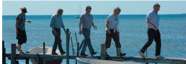
Som Cittaslow ønsker Svendborg at balancere mellem evnen til på én gang at bevare sin unikke lokale natur, kultur og historie og samtidig udvikle sig i takt med og i samspil med den globale verden.

En af måderne til at styrke værdiens fortsatte liv og fastholde den politiske opbakning er, at Cittaslow indarbejdes i Forslag til Kommuneplan09 som en tværgående værdi, og hvortil der bliver linket fra de relevante afsnit i hovedstrukturen. I Planafdelingen er vi overbeviste om, at hvis vi bliver gode til at knytte Cittaslow som styrende værdi til plankulturen, så vil det også naturligt kunne aflæses i den måde, som Svendborg kommer til at udvikle sig på i fremtiden.