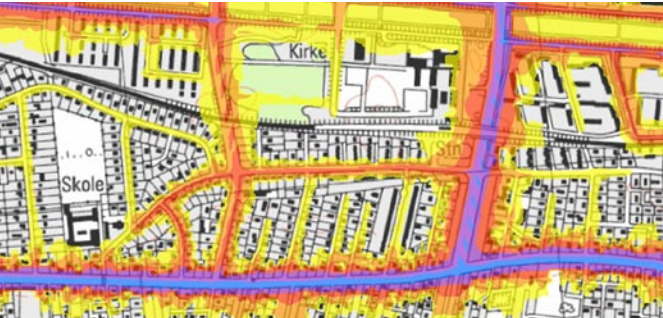
Eksempel på støjkort