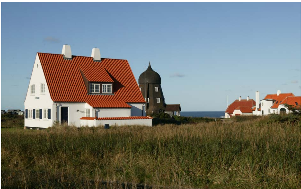
Møllebakken i Lønstrup – et kulturmiljø i Hjørring Kommune

I planstrategien er natur, landskab og kulturarv fremhævet som et særligt potentiale kommunen vil bruge til at skabe en skarp profil udadtil og indadtil. Forud for formuleringen af strategien ligger en analyse og vurdering af kulturmiljøer i kommunen - som bl.a. har været med til at sætte fokus på netop kulturarven og landskabets potentialer i forbindelse med attraktiv bosætning, oplevelsesøkonomi og turisme. Med udgangspunkt i strategi og det forudgående analysearbejde formuleres i kommuneplanen et selvstændigt tema om kulturarv og landskab.