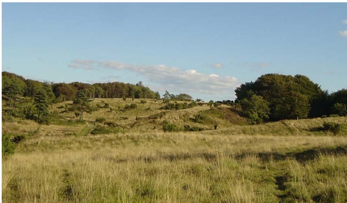
Hammer Bakker – en del af den grøn/blå struktur

I den grøn/blå struktur synliggøres de grøn/blå interesser og værdier i den samlede kommune, som et indspil til kommuneplanens hovedstruktur og afvejning af interesser samt til det videre arbejde med at formulere retningslinier og rammer for det åbne land. Der er i den grøn/blå struktur særligt fokus på samspillet mellem by og land og de bynære landskabers udviklingstendenser og muligheder.