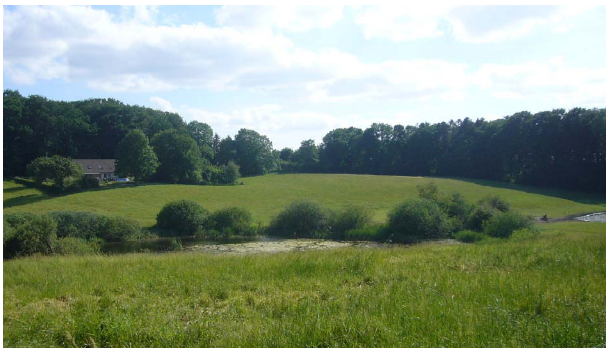
Bakkede dødis landskaber præger store dele af Faaborg-Midtfyn Kommune

Regionplanen for Fyns Amt er opdateret på en lang række temaer. De landskabelige udpegninger og retningslinjer er imidlertid utidssvarende og har ikke været opdateret i mange år. Endvidere er landskabstemaet meget overordnede og forholder sig kun til dele af landskabet - de værdifulde landskaber. Med udgangspunkt i en landskabskarakteranalyse, som Fyns Amt nåede at gennemføre, udarbejdes et nyt landskabeligt planlægningsgrundlag. Dette grundlag rummer både anbefalinger til landskabsplanlægningen for hele kommunens areal og til andre temaer, som har betydning for landskabet. Bl.a. gives anbefalinger til hvordan hensynet til landskabskarakteren inddrages i forbindelse med byudvikling, erhvervsudvikling langs den nye Odense-Svendborg motorvej, landbrug, skovrejsning og natur.