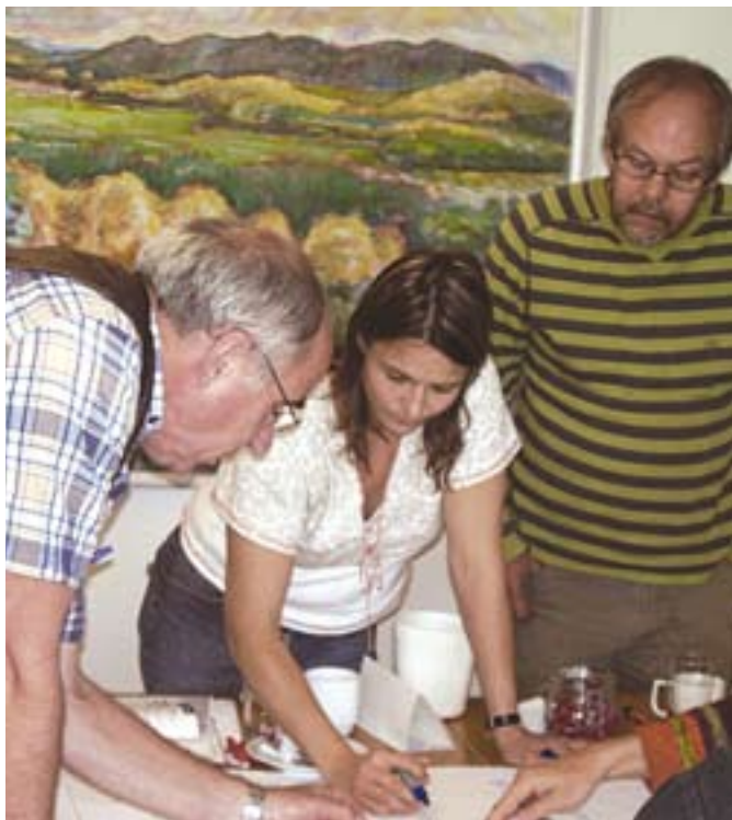
Demokrati og inddragelse.