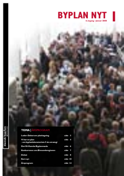
BYPLAN NYT nr. 1 / 2008 (6. årgang)

Redaktion Ellen Højgaard Jensen (ansv.) Ny Weisser Øhlenschläger