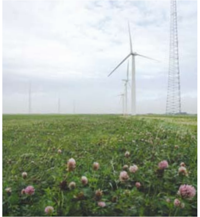
Det åbne land.