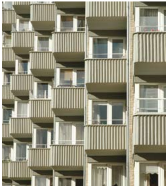
Den almene sektor.