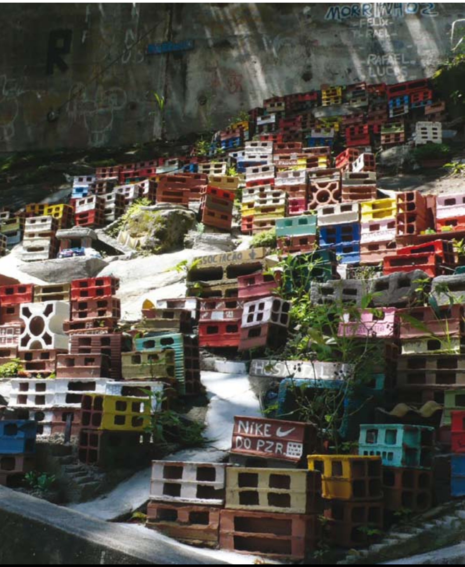
Fremtidens byplanlæggere. Brasilianske børn bygger deres kvarter i genbrugsmaterialer, Rio de Janeiro. Projektet er et besøg værd: www.morrinho.com .