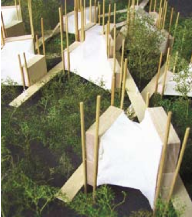
Klima og bæredygtig udvikling.