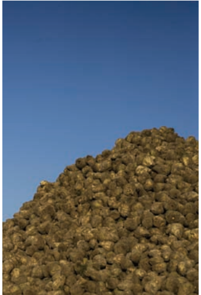
Halsted er en køn landsby. Selv landsbyens roedynger tager sig smukt ud på en kold vinterdag.

borgmester i Lolland Kommune og på vej ud ad døren til økonomiudvalgsmøde i Maribo. Bagefter skal hun til møde på Reventlow-museet, som hun er formand for, og drøfte de såkaldte herregårdsdage, som fra pinse og ti dage frem skal synliggøre Lolland-Falsters 64 herregårde ("folk tror, der er flere på Fyn"). Det gælder om at bryde billedet af Lolland som en nedslidt ø uden historie og attraktioner. Som det er tilfældet i mindre målestok i Halsted, er det samspillet mellem natur og kultur, der kan vises frem som det ægte lollandske guld. Det gælder om at se godt ud og have historien med sig. "Der er ingen tomme huse i Halsted, og alle godsets boliger er udlejede," siger hun. "Vi har lukket skolen, og det var slemt. Men der må være andre steder, hvor man kan mødes."