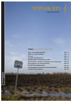
BYPLAN NYT nr. 1 / 2009 (7. årgang)

Redaktion Ellen Højgaard Jensen (ansv.) Marie Horskær Partoft