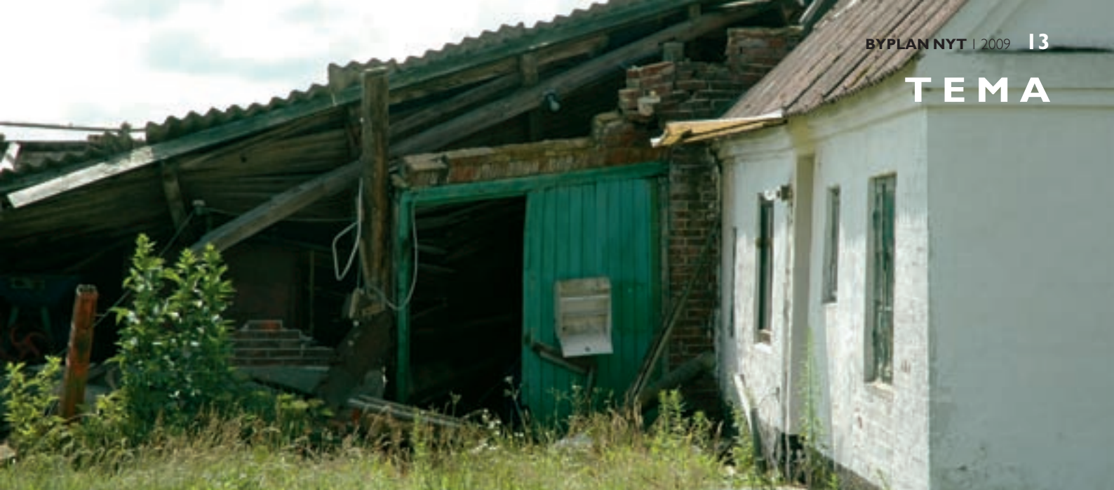
Faldefærdige rønner ikke bare skæmmer landsbyerne - de er også til fare for potentielle lejere.