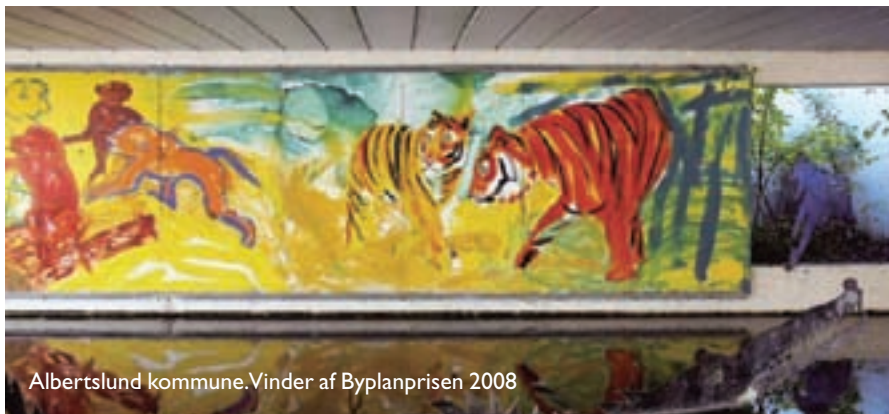
Albertslund kommune. Vinder af Byplanprisen 2008

Se nærmere om krav og procedurer på www.byplanlab.dk