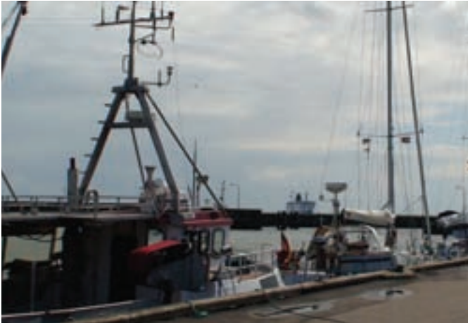
Fiskeri - og færgehavnen i Gedser er et centralt udviklingsområde, hvor kommunen samarbejder med det lokale erhvervsliv.