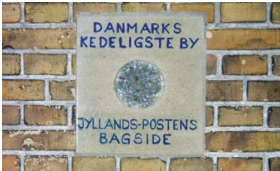
Flisen her er en "hædersbevisning" fra da Jyllandspostens bagside i 1996 kårede Hørдум til Danmarks kedeligste by. Motivet er et hul i jorden.

I 1996 kårede Morgenavisen Jyllands-Postens bagside Hørдум som "Danmarks kedeligste by", og ved en på én gang selvbevidst og selvironisk sammenkomst med omkring 200 deltagere om aftenen den 1. marts overrakte avisens bagsideredaktør en keramikflise til formanden for Håndværker- og Borgerforeningen. Flisen havde inskriptionen "Danmarks kedeligste by" og viste et billede af et hul i jorden. Det skete i byens forsamlingshus, indrettet i den bygning som var jernbanestation indtil byen i 1967 blev nedgraderet til trinbræt.