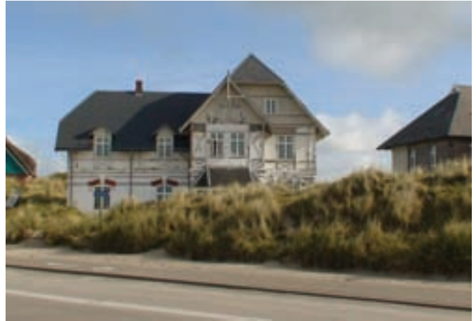
Fanø Bad var omkring 1900 stedet, hvor man satsede på international turisme, men i 1970'erne rev man mange bygninger ned efter en lang deroute.

Callisen. Scandlines er den absolut største arbejdsplads i hele området, og de er gået aktivt ind i arbejde med at forny området.