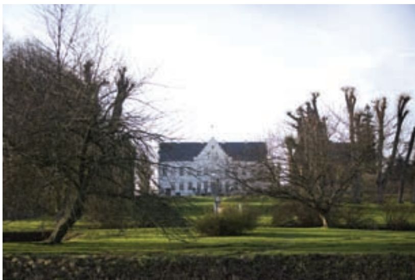
Idyllisk ser det ud en kold december dag i Halsted.