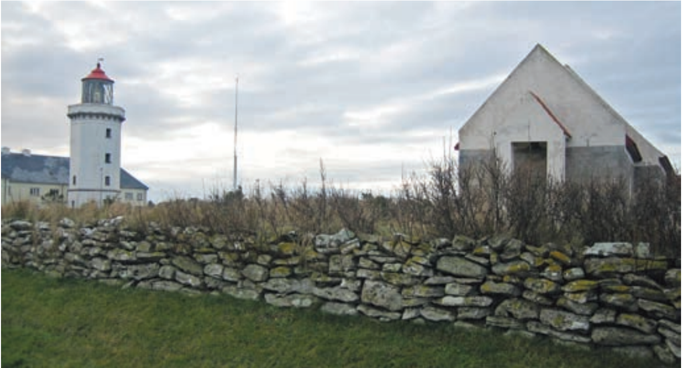
Velfærdsministeriets vejledning "Udvikling af landsbyer - En værktøjskasse" sætter fokus på mulighederne i de landsbyer, der ikke er attraktive som bosætningsbyer.

ikke i stand til at finansiere hele udgiften, har kommunerne gennem byfornyelsesloven mulighed for at give et tilskud, som kan motivere ejeren til at gå i gang. Af ressourcemeæssige årsager kan det være nødvendigt for kommunerne at prioritere deres indsats omkring de områder, hvor der er noget at bygge videre på.