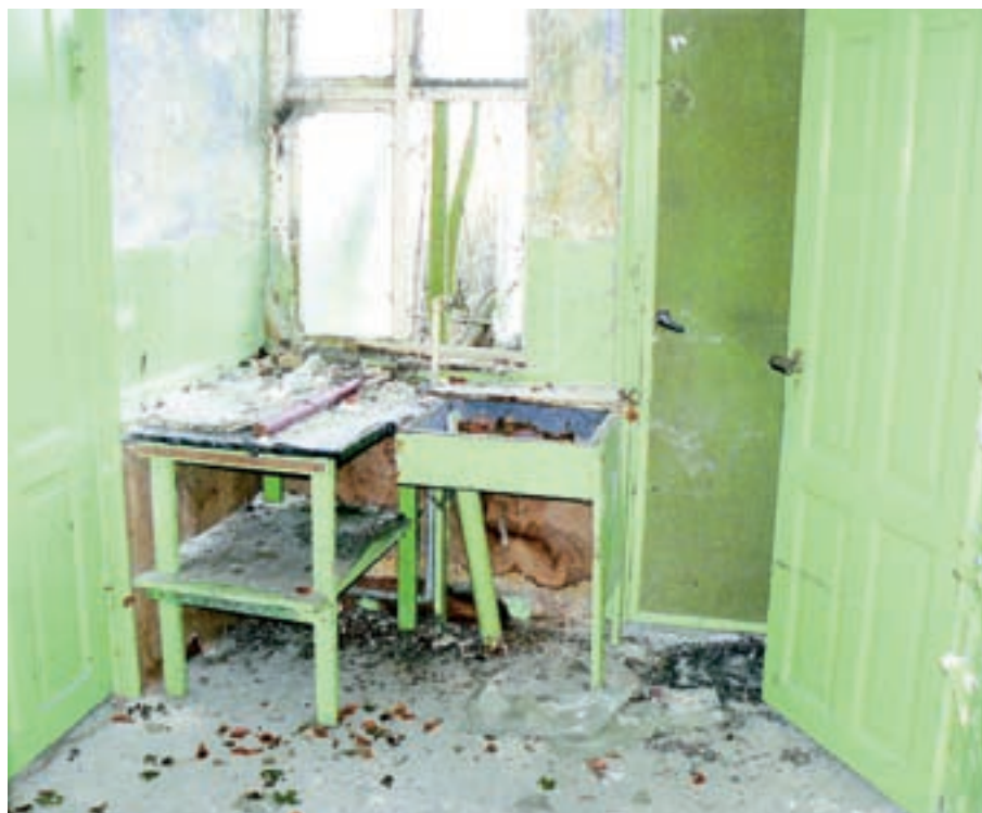
Landsbyernes dårlige boliger kan være sundhedsskadelige. I Lolland Kommune er planen at nedrive 40 -50 boliger årligt.