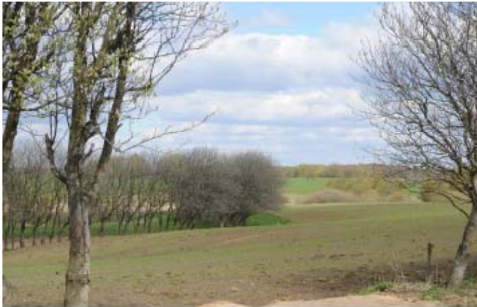
Udarbejdet af Esbjerg og Vejen Kommuner

Et hjælpehæfte til udfyldelse af skema til kortlægning og vurdering af landskabskarakterområder