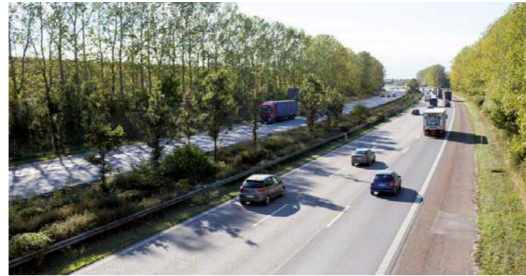
Illustration: Preben Skaarup Landskab

Nedenfor: Dialog er et nøgleord – der kan skabes større sammenhænge på tværs af motorvejen, ved at samarbejde med lodsejere – her ses et område i forbindelse med Silkeborg Motorvejen, der efterfølgende kan oversvømmes og dermed skabes der mulighed for en større biologisk diversitet.