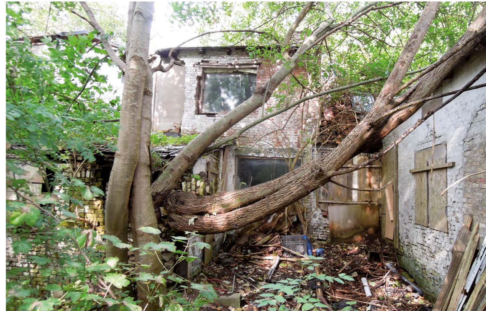
Flere kommuner har gode erfaringer med at ansætte en dedikeret boligsocial medarbejder til opgaven med kondemnering, genhusning og nedrivning. Her et ekstremt tilfælde.

– Problematikken er lige nu i Sønderborg Kommune, at jeg sidder med byfornyelsen og kigger rent fysisk på husene, og i de andre forvaltninger ser de på nogle andre parametre, så vi sidder i vores traditionelle opdelinger endnu. Og så er der ikke nogen, der vil være projektere. Det første spørgsmål, du bliver mødt af, er: 'hvem har så hatten på?' Hvis du skal lave noget