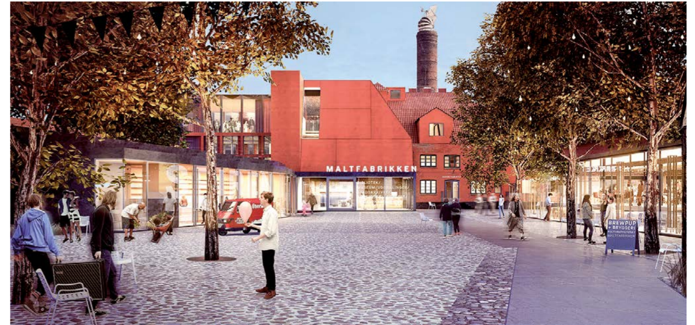
Illustration: Praksis Arkitekter

I Ebeltoft førte lokale ildsjæles initiativ til et samarbejde med kommunen, hvor begge parter har forpligtet sig til at investere tid og penge i at bevare og omdanne byens gamle maltefabrik. Omdannelsen er blevet omdrejningspunkt for en fælles strategisk byudvikling.