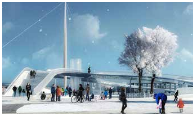
Illustration: gottlieb paludan