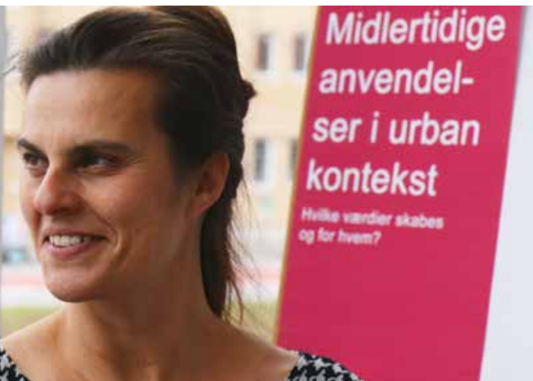
Samtale på Center for strategisk byforsknings stand.

markedsplads for gode idéer, er Transformationslaboratoriet også et sted, hvor Byplanlaboratoriet kan tage temperaturen på de vigtige diskussioner. En af de stande, som trak rigtig mange deltagere handlede om Business Improvement Districts (BID). Et BID er en model for, hvordan private og offentlige aktører kan have et fælles ansvar for drift og vedligehold af dele af det offentlige rum. Det er ikke muligt at love for BIDs i Danmark, men der laves forsøg med frivillige ordninger i Aalborg og Gladsaxe. På standen blev det blandt andet diskuteret, hvordan man kan implementere et forpligtende samarbejde i praksis, og hvordan det kan matche en nordisk velfærdsmodel. Det er tydeligvis et emne, som optager planlæggere og beslutningstagere i kommunerne. Byplanlaboratoriet vil følge emnet tæt i 2017, hvor vores indsatsområde er 'Erhverv, planlægning og mobilitet'.