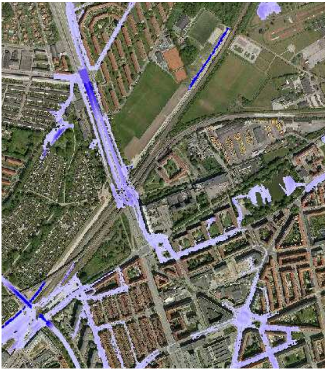
Kortet viser omfanget af en forventet 100-års oversvømmelse baseret på en koblet 1D-2D simulering af Storkøbenhavns afløbssystem og tilsvarende højdemodel.

Når rørmodellen finder frem til de steder og tidspunkter hvor ledningssystemet er så stærkt belastet, at vandet vil blive presset gennem brønde og op på terræn, bliver det overskydende vand overført til en overflademodel, der flytter vandet virtuelt fra modelcelle til modelcelle alt efter terrænets hældning og ruhed (2D-model).