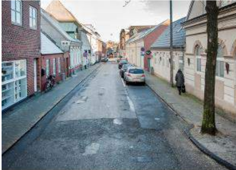
Jyllandsgade før fornyelsen