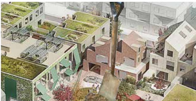
Illustration: Arkitema Architects