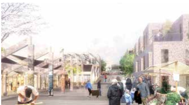
Illustration: Tegnestuen Vandkunsten