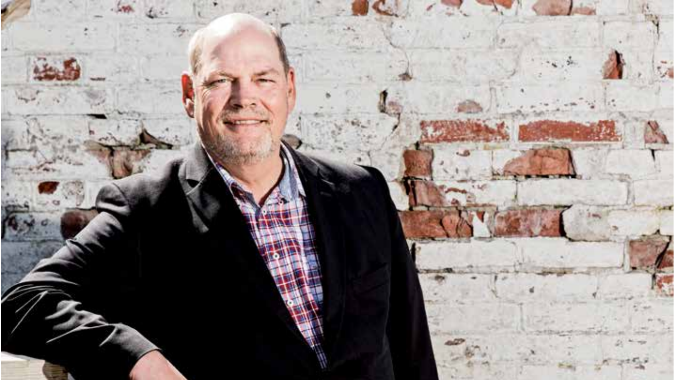
Transformationen af købstæderne er i fuld gang, mener Carsten Hansen, minister for By, Bolig og Landdistrikter.