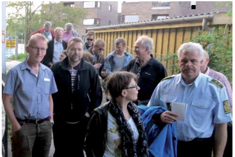
På en såkaldt tryghedsvandring gennem Skovlunde Bymidte fik repræsentanter fra Vestegns Politi, Ballerup Kommune, Centerforeningen, boligforeninger, lokalråd og arkitekter i projektets første fase et førstehåndstryk af kvarteret, dets stemninger og tryghed.

Ballerup Kommunes kriminalitetsforebyggende byplanlægning i Skovlunde Bymidte er en del af Det Kriminalpræventive Råd og TrygFondens projekt "Tryghed og mindre kriminalitet via byplanlægning". Den primære strategi er at skabe bedre uformel eller naturlig overvågning af byen ud fra teorien om at overtrædelse af alment accepterede adfærdsnormer er vanskeligere, når der er større risiko for opdagelse. Den normdannende, gode adfærd virker demotiverende for normbrud. Udover Ballerup Kommune deltager fire andre eksempelkommuner: Aarhus, Esbjerg, Kalundborg og Guldborgsund. Find anbefalinger til at indarbejde tryghed i plandokumenter i Det Kriminalpræventive Råd og TrygFondens nye guide på www.dkr.dk , hvor du kan læse mere om kriminalpræventiv byplanlægning. ■