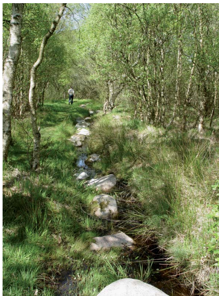
Trædestenene ved Aaby Bjerg.