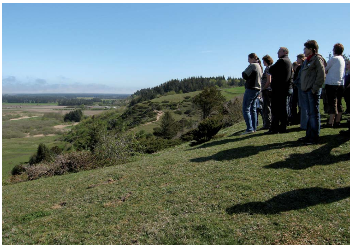
Udsigten fra Bakkegården ud over det flade land og havet.