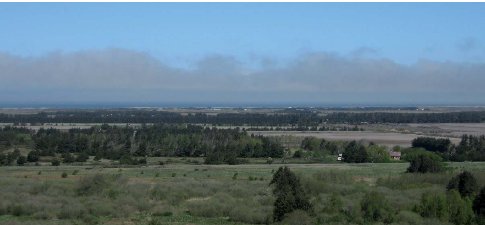
Udsigten fra Bakkegården ud over det flade land og havet.

Bag privatboligen "Bakken" på toppen af Lien, ventede os en storslået udsigt ud over det flade landskab foran indlandsskrænten. Skrænten har meget forskellig vegetation, og det er meget tydeligt at se forskel på den pleje der har været på Lien skrænter og på det flade forland foran Lien. De afgræssede områder er lysåbne og skræntens formationer ses tydeligt. Skrænten er meget kalkholdig og er et godt levested for bl.a. Storblomstret Kodriver og sjældne orkideer.