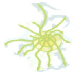
Princippet i den grønne struktur.