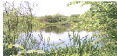
Det er hensigten at arbejde for et varieret naturindhold i de bynære landskaber.

Overalt er et varieret naturindhold og en biologisk mangfoldighed afgørende forudsætninger for opfyldelsen af såvel de rekreative, de visuelle og de naturbeskyttelsesmæssige mål.