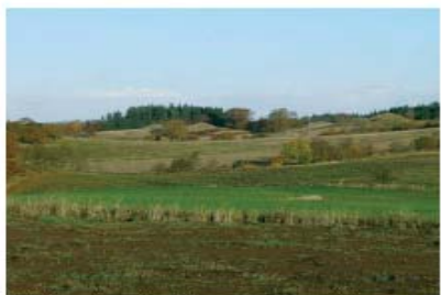
Oldtidens nandmorænelandskab: Højen-Bjørnager - Ellevejhøje