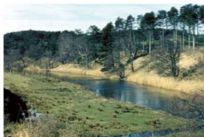
Jægerstenalder: Uggerby Å som et eksempel på et af jægerstenalderens vigtige landskaber til bosættning