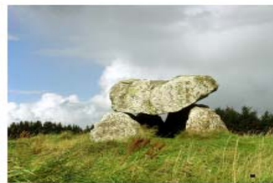
Bondestenalder: Tomby Dyssen - Danmarks nordligste stendyss