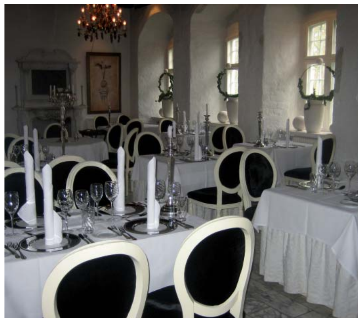
Det gamle slot bruges i dag til fest og ferieophold.