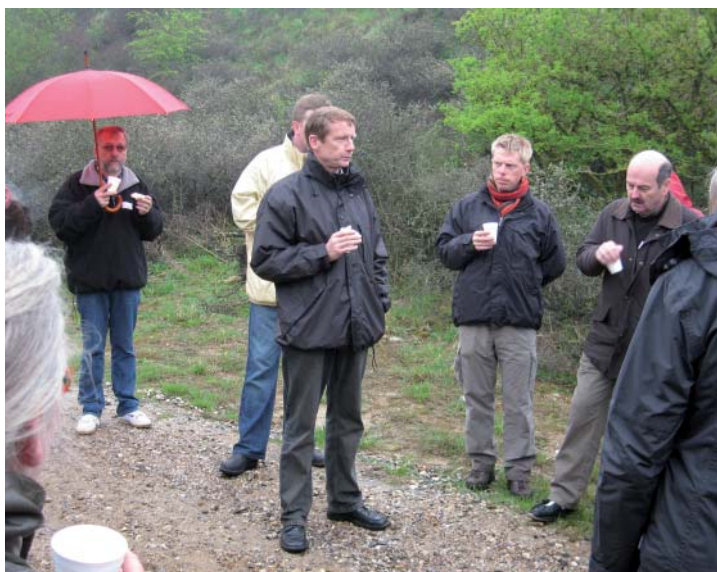
Diskussion over kaffen for foden af Bjergget

Set i det lys at omkostningerne til udbygning og vedligehold af diger og pumper stiger på grund af hævet vandstand og stigende el-priser, mens indtægterne fra drift af planteproduktion på markerne falder på grund af faldende priser på landbrugsprodukter. Samtidig er der en bred interesse for at skabe ny natur i Danmark.