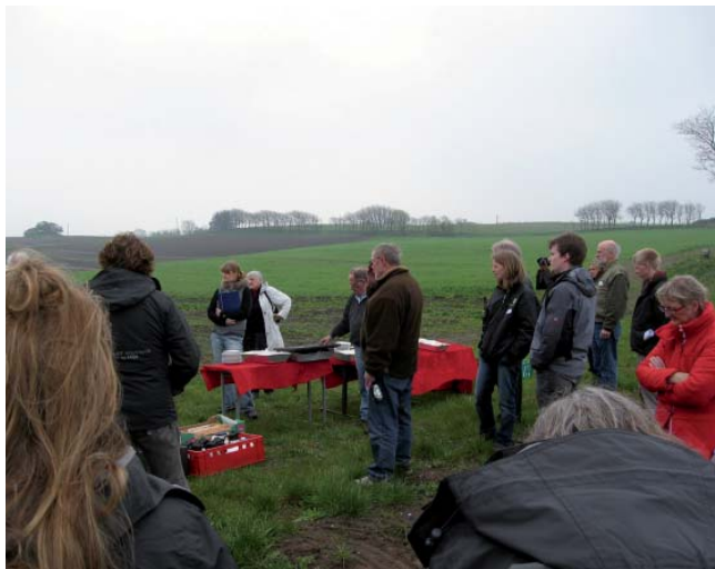
Frokost i det grønne hos Råd og Dåd i Skovsgård