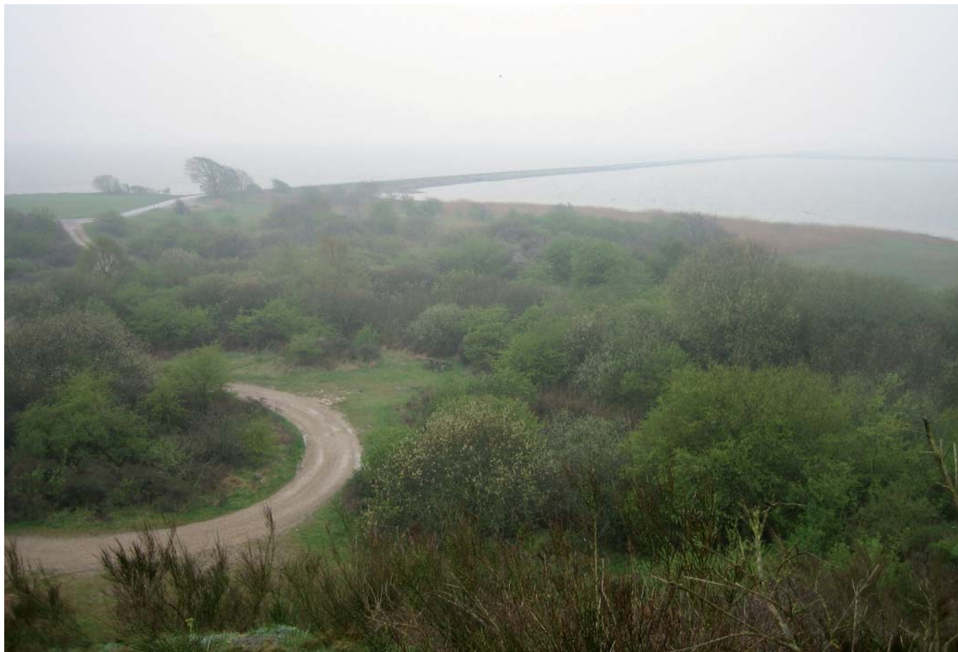
Ulvedybet og dæmningen set fra Bjerget.