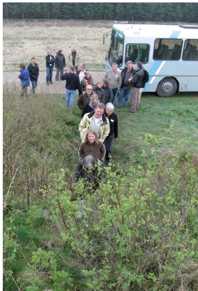
Alle deltagere var en tur inde i Hvisselhøjs tre kamre.