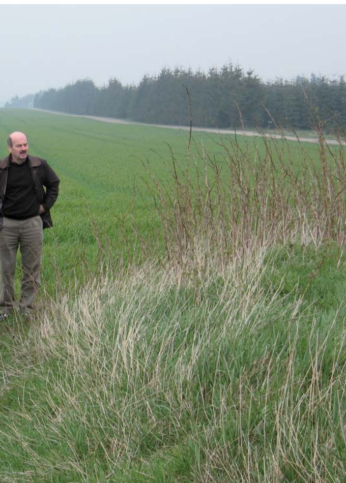
På bagsiden af Hvisselhøj har lodsejeren pløjet meget tæt på, og har dermed skåret en dyb kant ind i højen.

bl.a. nedsætninger ved foden af højen eller tilføre næring til skrænterne. I dette tilfælde har landmanden været meget tæt på højen og ikke overholdt denne 2m zone. Det er tydeligt at se på vegetationen på højen, at den har taget skade af det omkringliggende landbrug. Her vokser hindbær og hundegræs i modsætning til f.eks. Blushøjs beplantning af tjærenellike og vejbred, som et resultat af forhøjet næring i jorden. Det kan diskuteres om kommunen skal lave opøgende arbejde finde overtrædelserne?