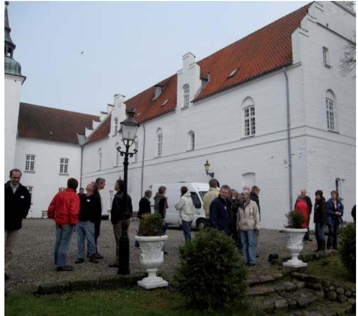
Kokholm Slots i slotsgården.

Bussen fortsatte nu mod det gamle herregårdsmiljø omkring Kokkedal Slot. Bygningerne er fra omkring 1540, og herfra har al færdsel på Limfjorden været overvåget. I dag drives der restaurant og hotel, og på den måde kan man endnu få et godt indtryk af historien og kulturmiljøet er bevaret.