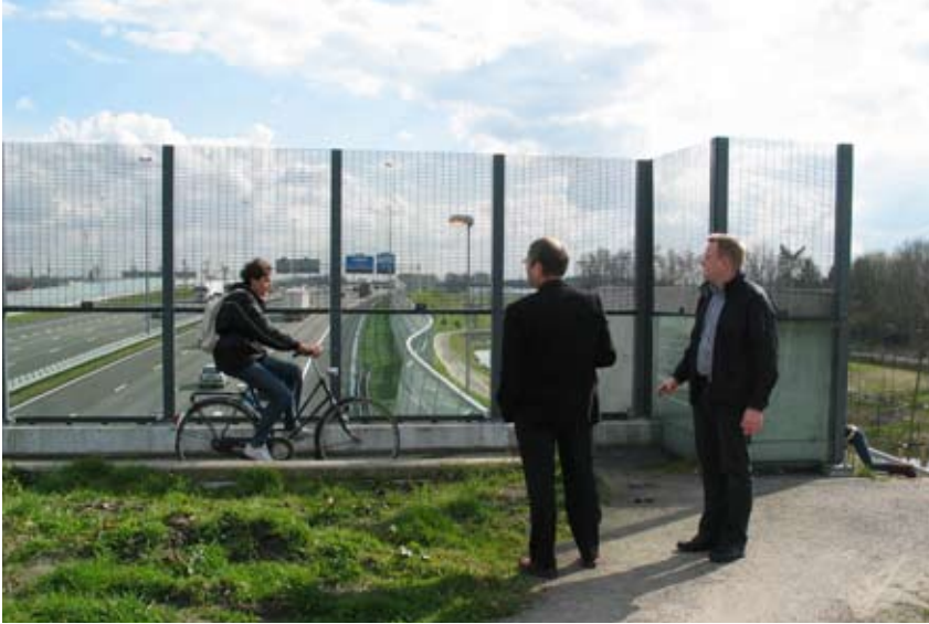
"Landskabet føres over vejen"