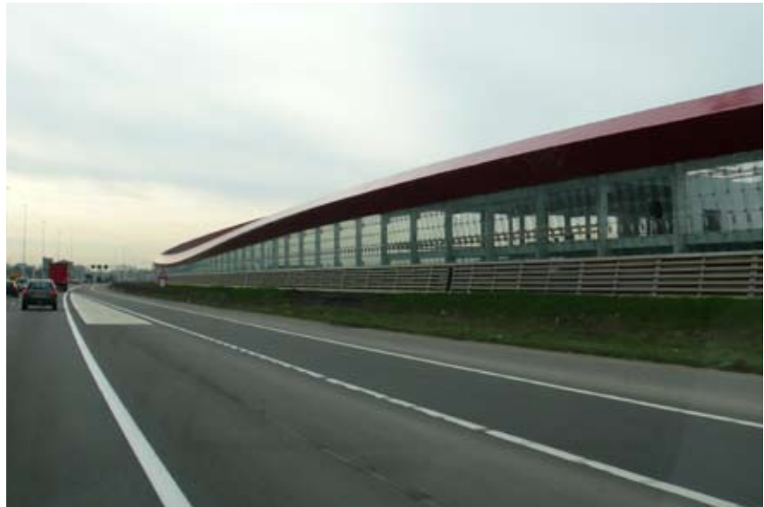
"Det kommercielle danner støjskærm og vejrum"