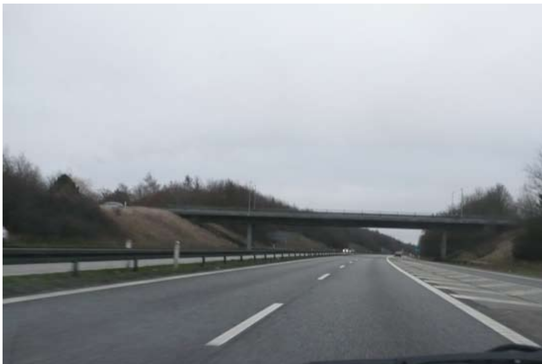
"Man skal ikke skjule en overgang"