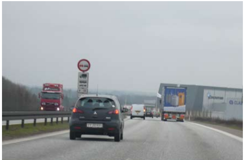
"Et stort fremmedlegeme - bygningen indtager vejen men giver intet tilbage"