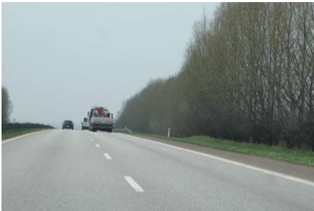
"Ro på bakketoppen"