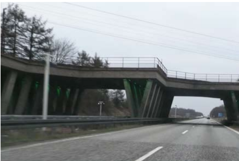
"Det ligner et jordskælv"