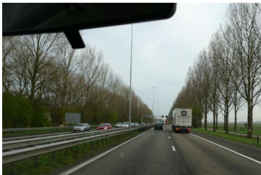
"Ro i et asymmetrisk vejbillede"