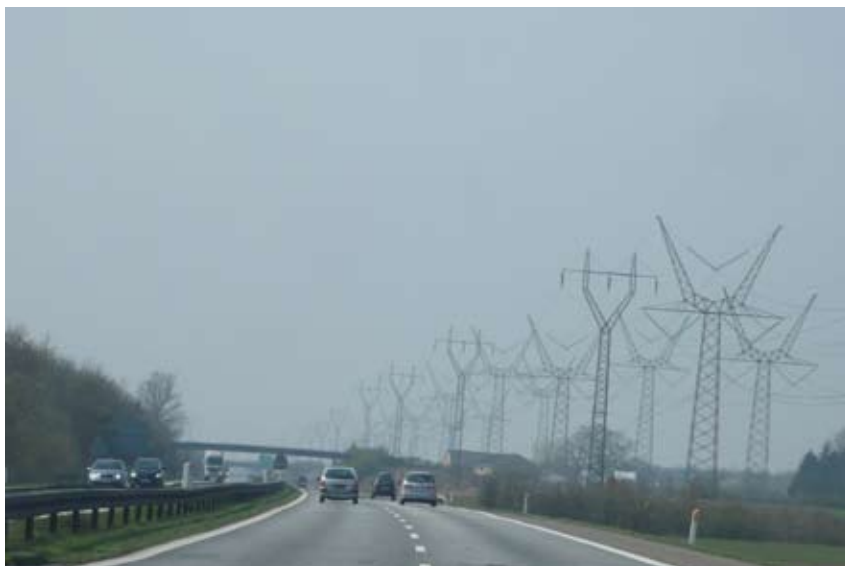
"En teknisk korridor af kaos"