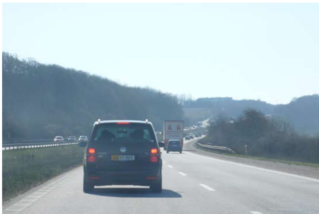
"Når vejen flyder som en sytråd gennem landskabet"