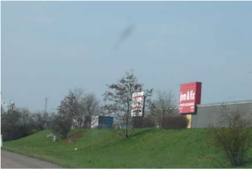
"Skiltning, fælles byghøjde og stern giver både ro og reklame på én gang"