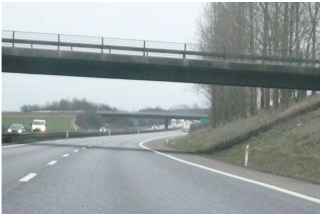
"Læg skråningsfoden fri"