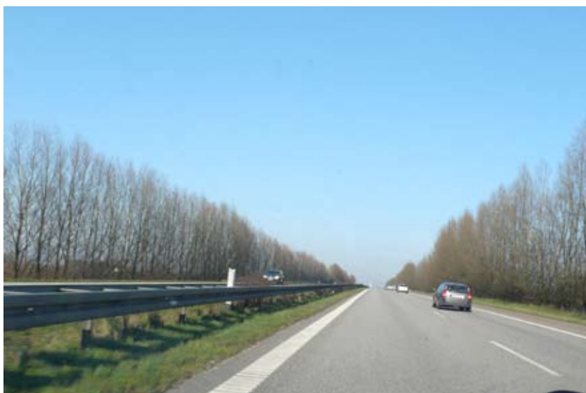
"Træækken er bedst når den kurver"