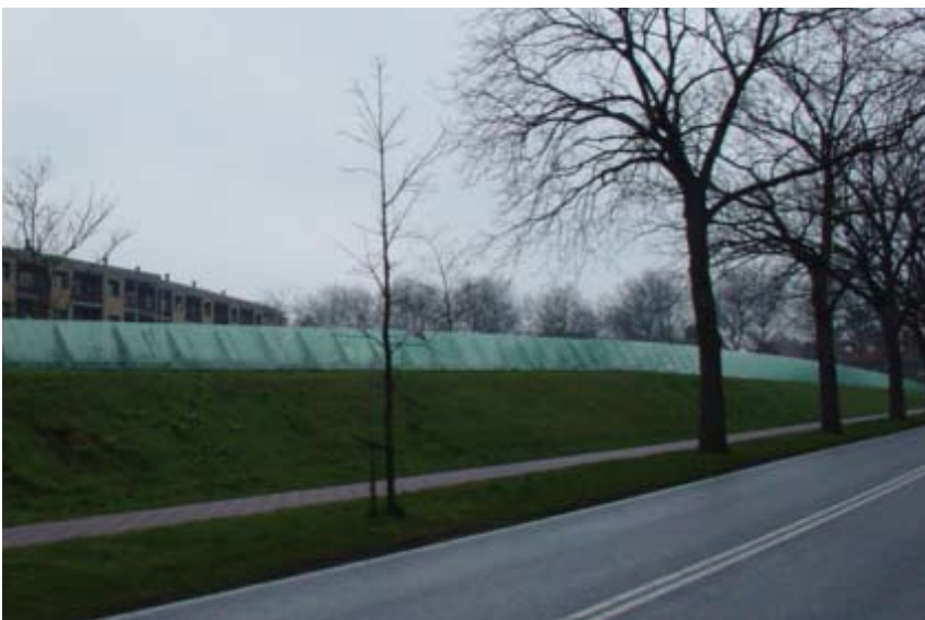
"Støjskærm indeholder boliger"