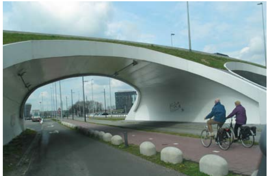
"Formsproget bruges bevidst"