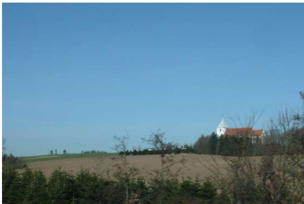
"Tæt på det sakrale - men ikke for tæt"