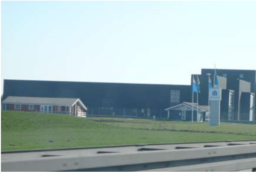
"Skala - der er ikke mere at sige"