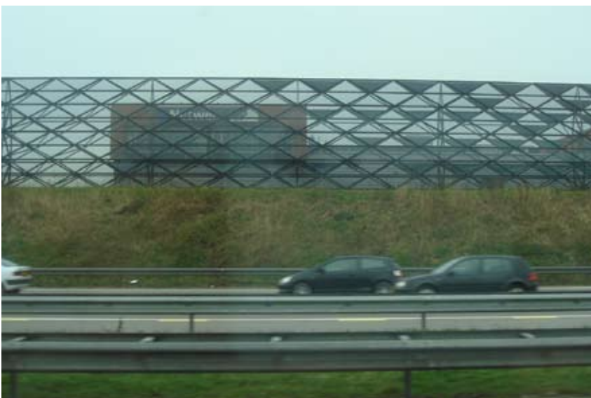
"Landskab, skærm og diskret erhverv"