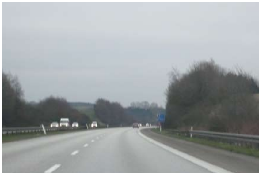
"Skulderpuder på landskabet gavner ikke"