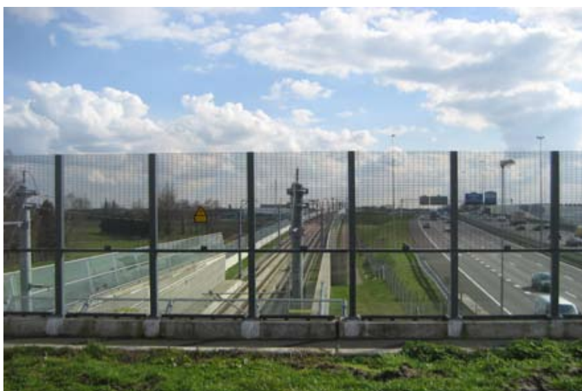
"En struktureret korridor"