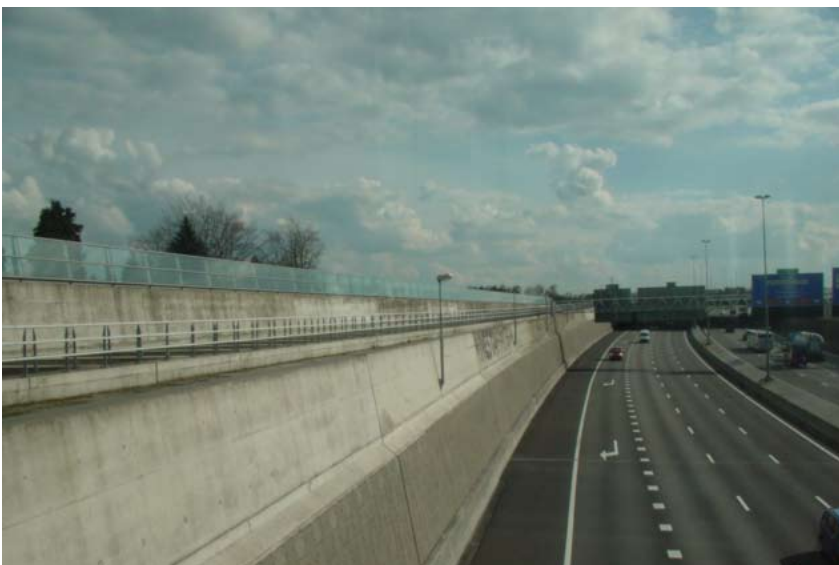
"Vejen afsondres fra omgivende landskab"