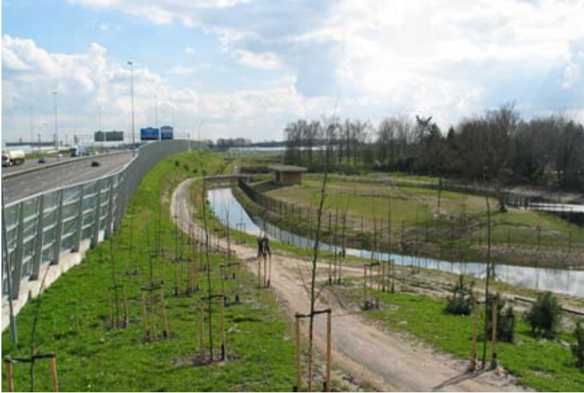
"Rekreativt landskab flankerer vejen"