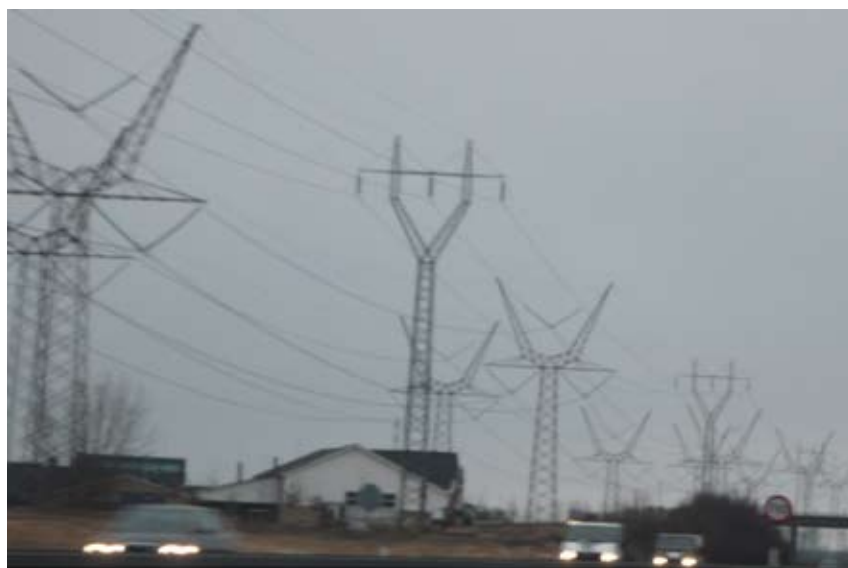
"Det er ren godnat"