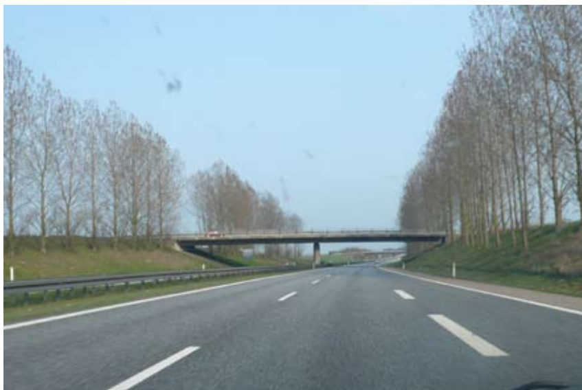
"En træække som persienne og kant for vej"