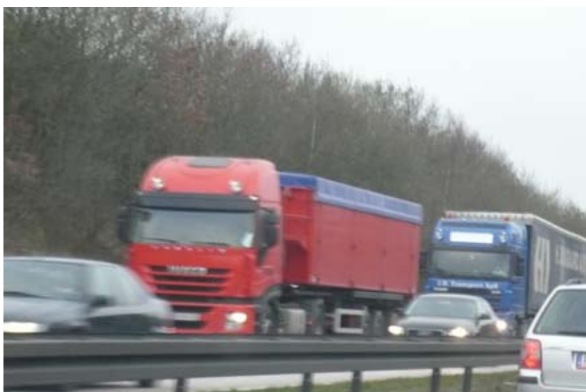
"Beplantning kan holde sammen på vejen når "bussen kører"