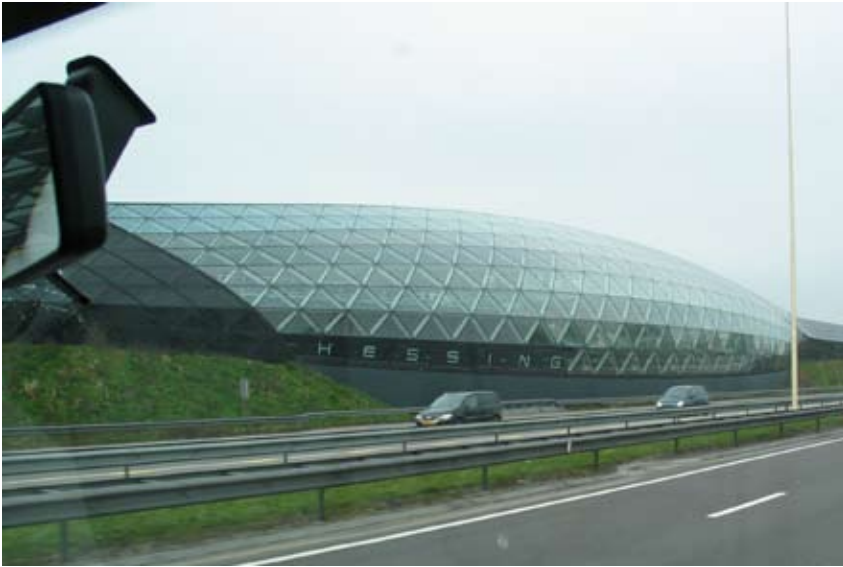
"Det kommercielle danner støjskærm og vejrum"