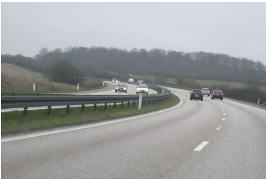
"Som vej og landskab er mest - heldigvis"