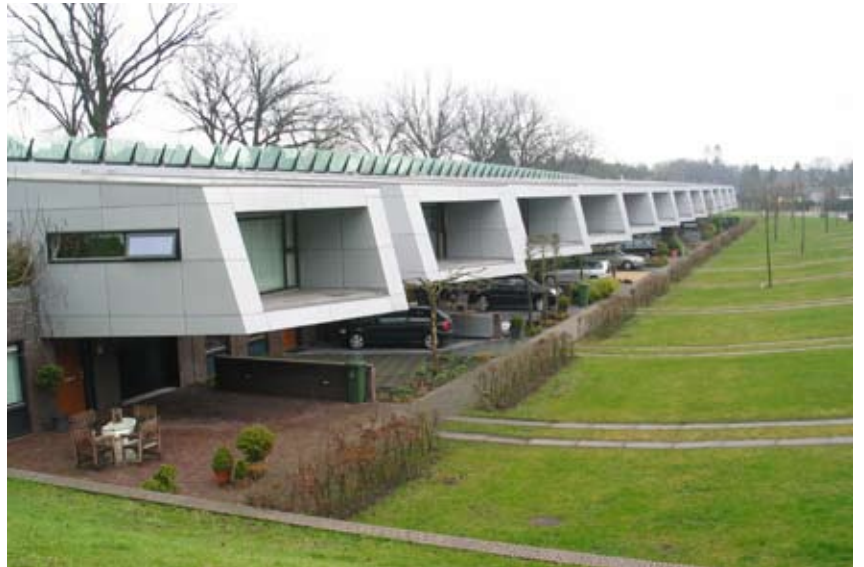
"Støjskærm danner bagvæg for bolig og have"