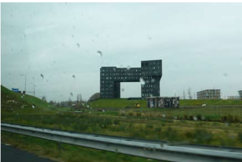
"Mellemland med ekstrem eksponering "