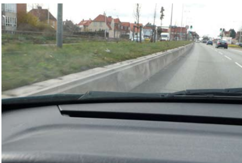
"En høj rabatkant kan give støtte i et rodet bybillede"