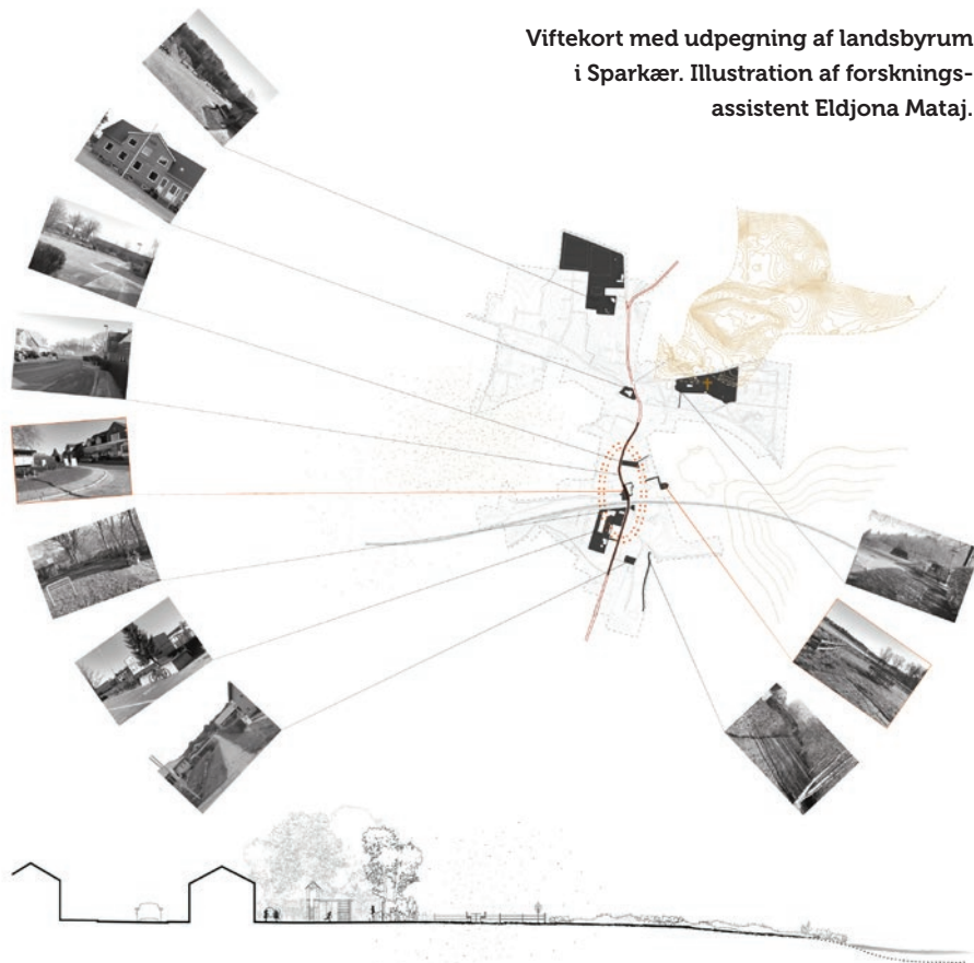
Viftekort med udpegnings af landsbyrum i Sparkær. Illustration af forskningsassistent Eldjona Mataj.

Det 1-årige pilotprojekt har til formål at bidrage til en dokumenteret indsigt i landsbyrummene – på deres egne præmisser. Det kortlægger, hvilke fælles rum der findes i landsbyerne og deres fysisk-rumlige kendetegn for bedre at forstå, hvilke roller landsbyrummene spiller for hverdagslivet i landsbyerne. Undersøgelserne er foretaget i syv landsbyer med 200-1000 indbyggere geografisk placeret i et undersøgelsesfelt i Nord- og Midtjylland. Metoden er empirisk, multiskalær og kortlægger landsbyrum i kontekst af landsbyen og landdistriktet gennem desktop arbejde, feltarbejde, fotokartering, timelapse fotomontager og observationer. Projektet afrundes i januar 2023 med et afsluttende webinar og offentliggørelse af et Atlas for Landsbyrum.