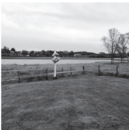
Feltarbejde i landsbyen Sparkær.