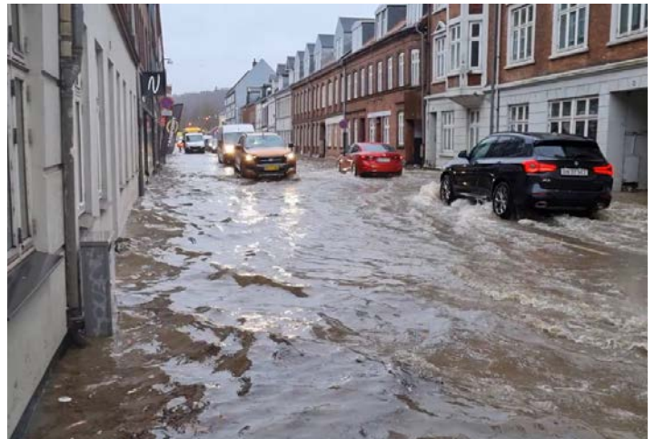
Februar 2024: 61 mm regn på et døgn betød vand på vejene i Vejle Midtby.

VANDET TRUER VEJLE! Det fik vi illustreret i fuld skala i februar. Opgaven er så stor og vigtig, at alle aktører skal samarbejde. Dialogmøder mellem kommune, borgere, byggebranche og vidensinstitutioner er et redskab i situationen. Kommunens budskab er: "Kom og hjælp os med at skabe den gode by"!