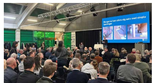
Idemøde om vandet i Vejle. Mange deltagere har forslag og ideer til løsninger.

I kommunerne har vi en stor opgave med at bevæge os fra at være en organisation til at være en organisation. Hvor vi ikke udelukkende stiller os op med myndighedskasketten på, men hvor vi også tør at facilitere dialogmøder mellem kommune, borgere, byggebranche og vidensinstitutioner. Hvor vi slår vinduet op og siger "kom og hjælp os med at skabe den gode by".