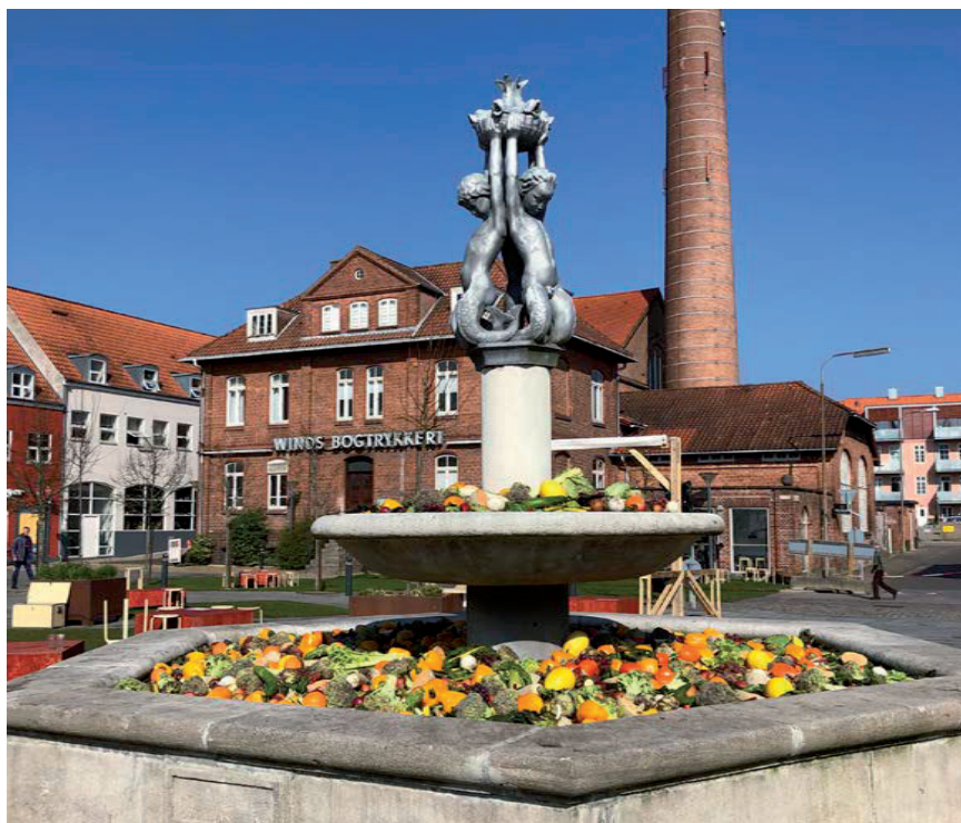
Værket 'Leben still leben' ved afprøvningens start.

Udviklingsplanen er stadig under udarbejdelse, afprøvningsresultaterne har været en succes, det samme har samarbejdet med de mange borgere, politikere, rådgivere, projektmagere og andre aktører, der har bidraget på forskellig vis. Udviklingsplanen forventes godkendt juni 2019.