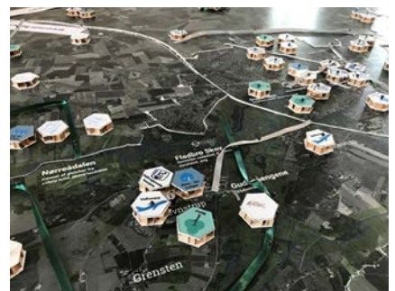
Udsnit af brætspillet, hvor bl.a. kortlægning af infrastruktur og grønne bånd ses.

Potentialevurderingen blev præsenteret på en workshop for byrådet. Efterformidling af resultaterne, faciliterede projektlederen nogle settings, der tog byrådet gennem en kortlægning af kommunens egne. Et af formålene med workshoppen var at skabe forskellige fortællinger egnene imellem. Behovet for differentierede fortællinger var netop en vigtig pointe i potentialeanalysen. For at omdanne data til fortællinger blev anvendt visualisering, fysiske modeller og brætspil for at åbne for den kreative tankegang. Data kunne med brætspillet dermed gøres 'håndholdt'. Kommunens helhed blev opdelt i seks spillebrikker, der hver blev analyseret og kortlagt ud fra forskellige identiteter. I arbejdet blev der taget højde for såvel strategiske placeringer af typologier med fokus på målgrupper samt fordeling af funktioner og mødesteder.