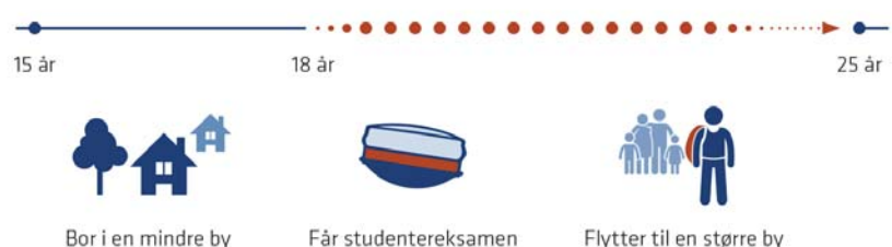
Figur 1: Analysedesign

Unge valg af ungdomsuddannelse spiller altså en stor rolle for, hvorvidt de fraflytter eller ej. På et samfundsmæssigt plan betyder det, at når flere unge vælger at gå i gymnasiet, så har det betydning for den øgede urbanisering,