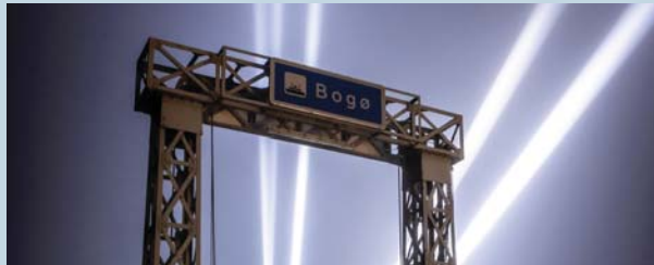
Lysfestivalen Den Første Dag i marts. Båll & Brands lyskunst ses her ved Stubbekøbing Havn.