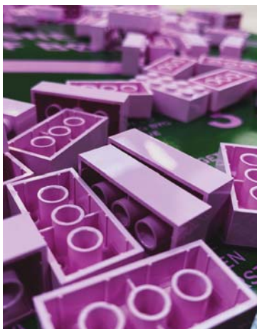
SUPERFLEX vil bruge lysrøde LEGO-klodser i udviklingen af et nyt byrum i Billund.

Vinduerne på biblioteker og kulturhuse i Hadsten, Hammel, Hinnerup og Ulstrup har i februar været under forvandling. Kunstneren Phuc Van Dang har skabt et kunstværk af sirlige sorte og hvide tapeudsmykninger i vinduespartierne. Motiverne har lokale kommet med forslag til under temaet "Det glæder vi os til", når coronapandemien er kommet under kontrol. Projektet har også været en opfordring til at lave tapekunst på ens eget vindue derhjemme, og her har børn og voksne kunne hente egnet elektriktape på det lokale bibliotek.