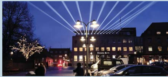
Årets lysfestival i Roskilde. Stændertorvet blev oplyst af Båll & Brands installation 'Viften', som lyste hen over byens tage.

Også Guldborgsund Kommune har taget lyskunsten til sig. Den første dag i marts blev lysfestivalen af samme navn afholdt, hvor lysøjler af kunstnerkollektivet Båll & Brand brød mørket og bandt havnebyerne Nykøbing Falster, Stubbekøbing, Gedser, Nysted og Sakskøbing sammen.