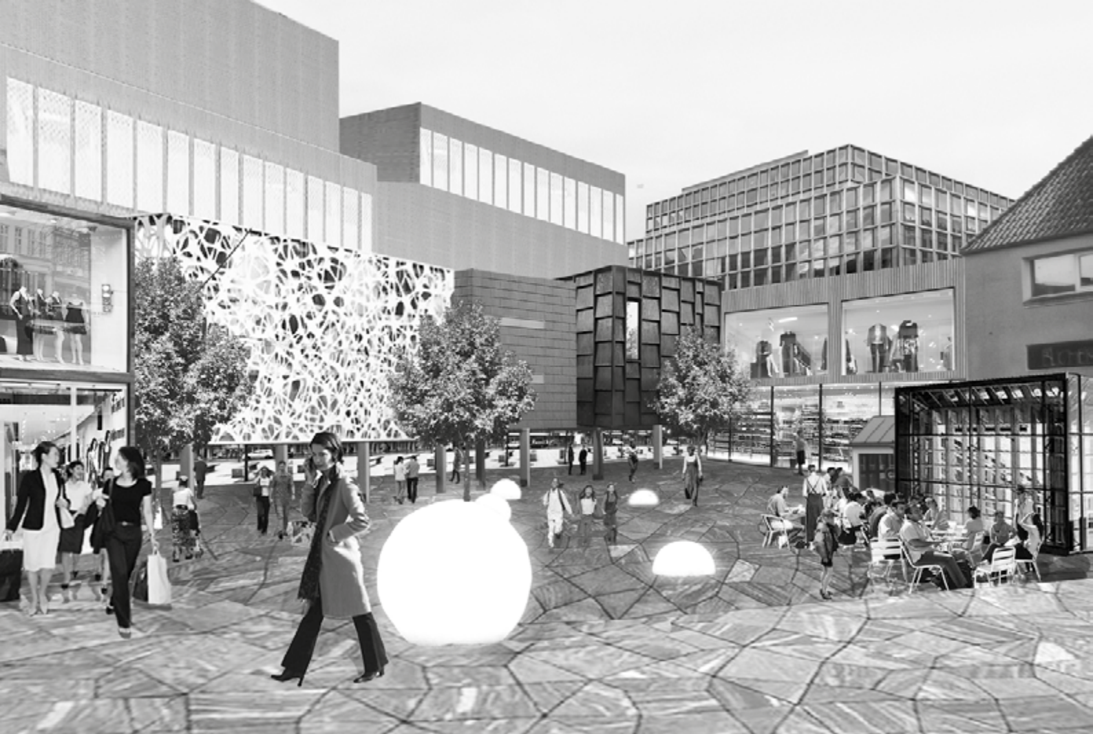
Illustration: Randers Kommune

rolle. Men dennes betydning vil sandsynligvis formindskes i takt med, at Plan09-strategien forankres hos politikerne.