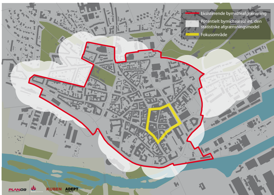
Illustration: Randers Kommune