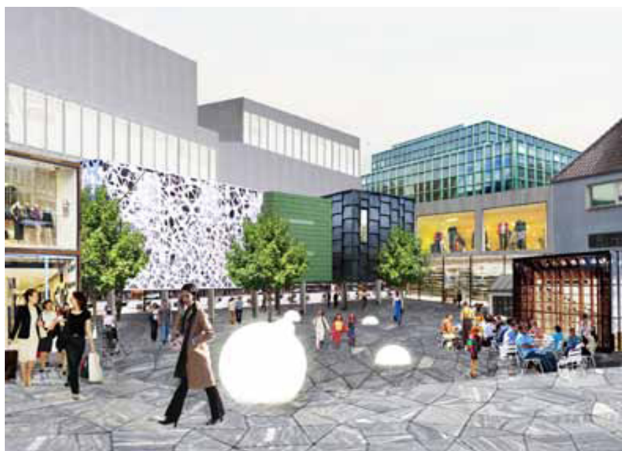
Illustration: Randers Kommune

Derfor er der stor forskel på det netværk de lokale interessenter har i byen og det niveau, de eksterne developere skal handle ud fra. Som alle steder spiller lobbyisme en